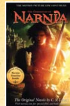
Die Chroniken von Narnia: Prinz Kaspian; das Buch zum Film

Zu den bereits bekannten außergewöhnlichen Charakteren in Narnia gesellen sich neue, von denen einige auch in weiteren Verfilmungen der Narnia-Chroniken erscheinen werden, wie zum Beispiel Riepischiep, die couragierte Maus, Doktor Cornelius, der weise Lehrer von Prinz Kaspian – und viele mehr. Die Pevensie-Geschwister sind voller Erinnerungen, als sie in Prinz Kaspian erneut nach Narnia kommen. Regisseur Andrew Adamson erging es ebenso. Er und auch die Mitarbeiter von Walden Media konnten es kaum erwarten, zu den Abenteuern und den wundervollen Landschaften in Narnia zurückzukehren. Den vielleicht besten Grund zurückzukehren nennt Aslan selbst, denn in Narnia, so ruft er Lucy in Erinnerung, „geschehen die Dinge niemals zweimal auf dieselbe Art und Weise.“